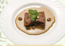
生チョコ風ケーキ