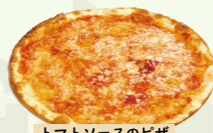
トマトソースのピザ