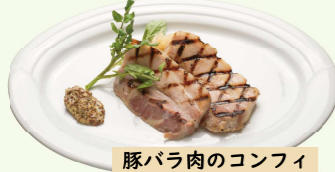
豚バラ肉のコンフィ