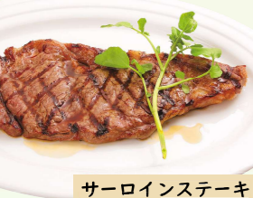
サーロインステーキ