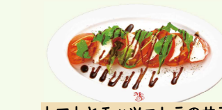
トマトとモッツアレラのサラダ