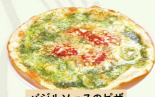
バジルソースのピザ