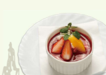
ミルクプリン いちごソース