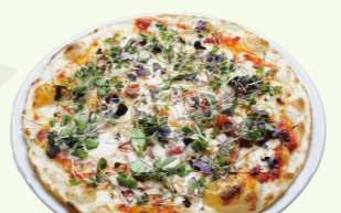
マイクロハーブと生ハムのピザ