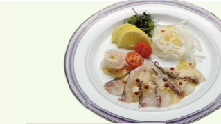
真鯛のカルパッチョ