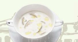
菊芋と蛤のポターージュ