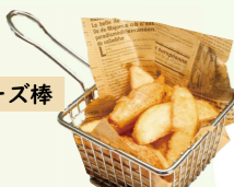
皮付きフライドポテト