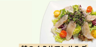
鯖のイタリアンサラダ