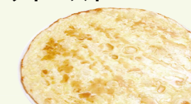
5種のチーズとメープルのピザ