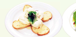
マスカルポーネのはちみつ風味