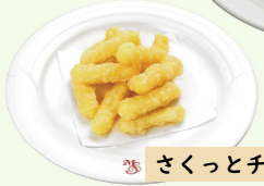
サクッとチーズ棒