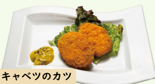
イカとキャベツのカツ