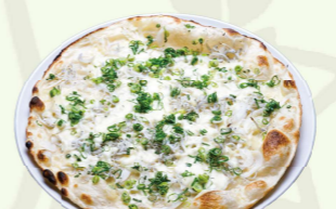
新玉葱としらすのピザ