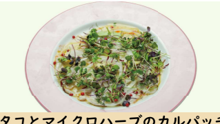
タコとマイクロハーブのカルパッチョ