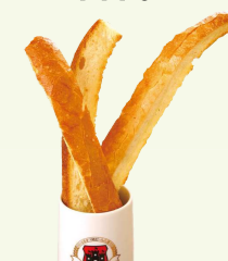
ガーリックトースト