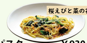
桜えびと菜の花のパスタ