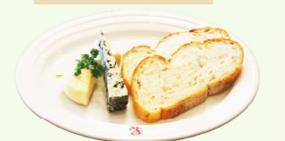
チーズ3種盛り合わせ