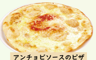
アンチョビソースのピザ